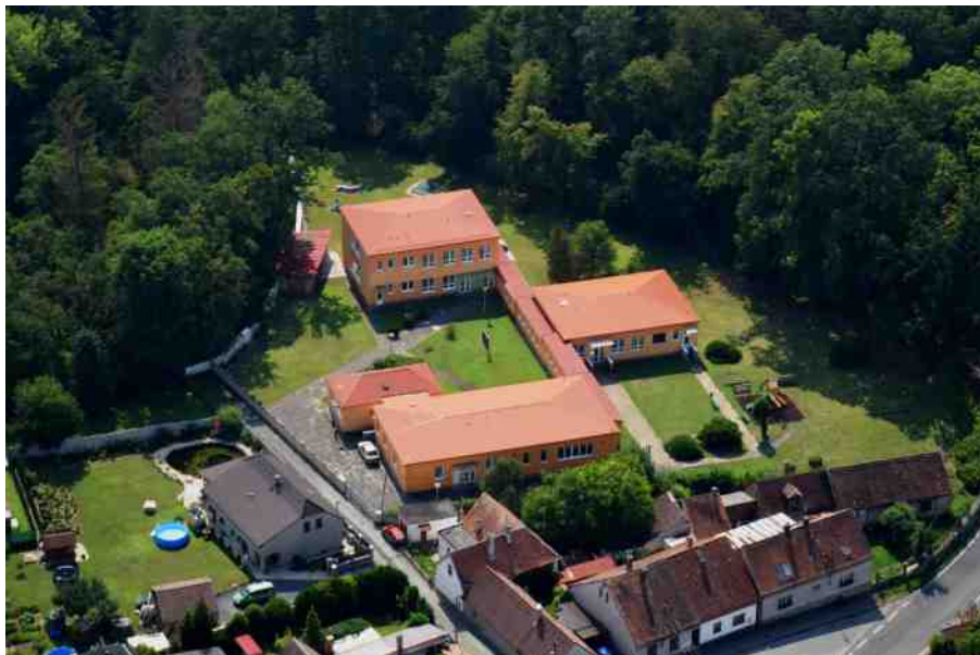
Mateřská školka Žleby léto 2019

Ve fázi rozpracovanosti je projekt Naučné stezky ve Žlebech a bodových informa-