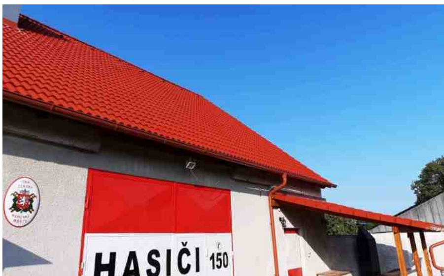
Střecha v Zehubech léto 2019

čních panelů v ostatních místních částech, plán letní údržby obce, investiční plán obce, územní plán obce, dotace na dětské hřiště, víceúčelové hřiště u školy a traktor pro údržbu obce, projekt na opravu domu č.p. 15, na opravu staré radnice, klubovny holubářů, úpravy sběrných míst na tříděný odpad, rekonstrukci budovy základní školy a lávky v parku.