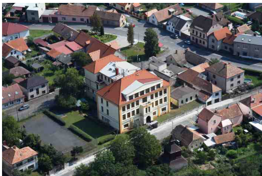
Základní škola Žleby léto 2019