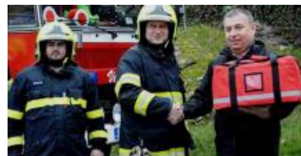
Slavnostní předání přístroje

byli hasiči proškoleni v zacházení s defibrilátorem a nyní jsou připraveni na pokyn operačního střediska v odůvodněných případech odborně zasáhnout.