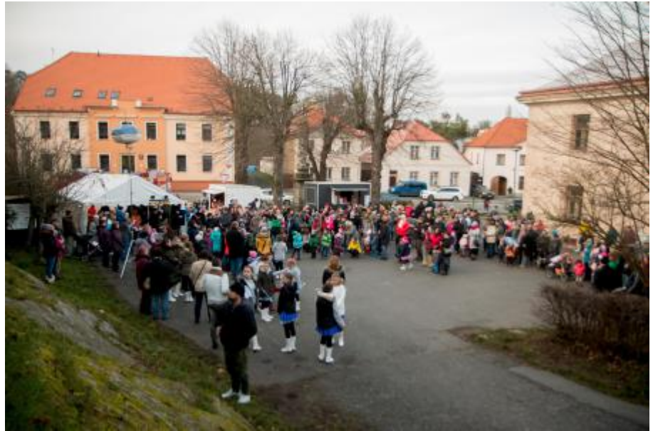
Účinkující i diváci kulturního programu při rozsvěcení stromku.

O bohatý kulturní program se postarali žáci a učitelé ze základní i mateřské školy, kteří nacvičili několik vánočních písní.