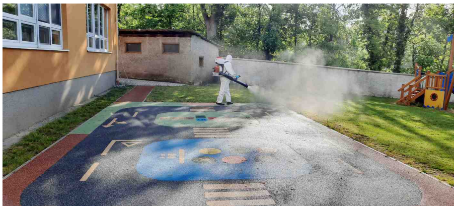
Provádění dezinfekce venkovních prostor mateřské školy jednotkou SDH.