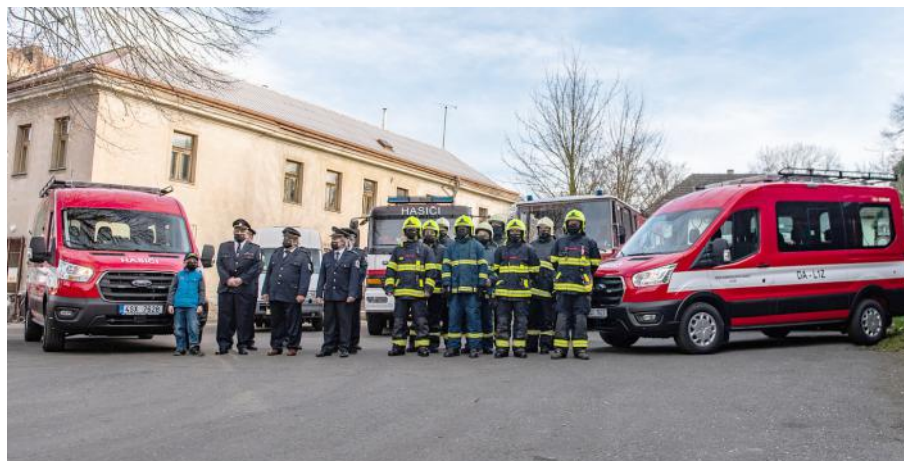
Slavnostní předání vozidel za účasti ředitele územního odboru Kutná Hora.

nahradila a doplnila vozový park obou JPO. Nově mají hasiči dva automobily Ford Transit, žlebstí hasiči cisternu Mercedes a zehubstí hasiči přívěsný vozík za svůj Ford Transit.