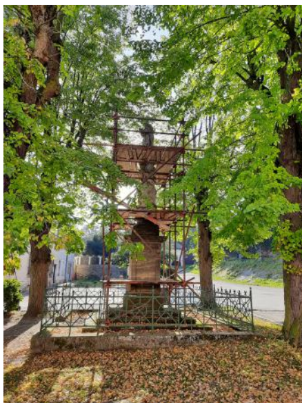
Mariánský sloup, Zámecké nám.

Termíny ukončení rekonstrukce ZŠ a ulice Za Šumavou se, bohužel, prodlužovaly znovu hned na zářijovém zasedání. V ulici Za Šumavou došlo k prasknutí vodovodního řadu a je nutná jeho celková rekonstrukce. Tato bude probíhat v režii VHS a obyvatelé díky výměně řadu budou muset snášet ztížené podmínky v ulici déle, než bylo plánováno. Na druhou stranu je lépe, že vodovod praskl teď než později pod nově zrekonstruovanou ulicí. Ani další bod srpnového jednání nebyl veselý. Na základě průzkumu provedeného na Mariánském sloupu na Zámeckém náměstí bylo zjištěno, že jeho stav je havarijní a hrozí jeho zřícení. Paní starostce se podařilo získat finanční dotaci z havarijního fondu ministerstva kultury, aby bylo možné zahájit kroky na jeho záchranu. Tyto kroky budou spočívat, v sejmutí volných částí sloupu, které budou uloženy v depozitáři, a bude provedena sanace a zpevnění podstavce a pevně připojených částí sloupu. Náklady na celkovou rekonstrukci sloupu byly již dříve vyčísleny na částku kolem 1,2 milionu korun, což je suma, kterou v současné době obec nemůže na tuto akci vynaložit. Proto zastupitelé zvolili