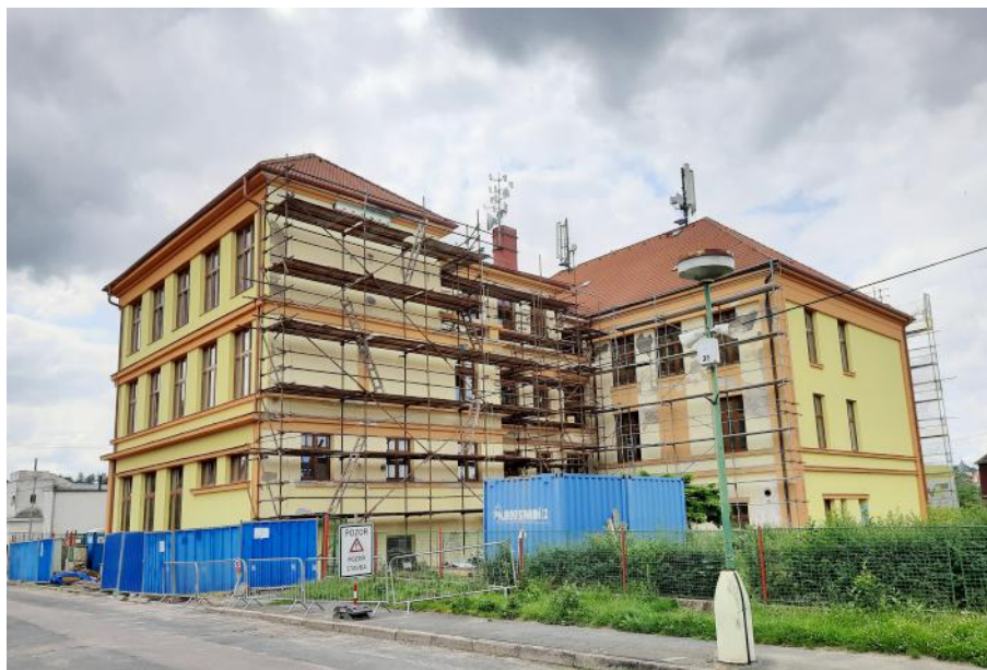
Budova základní školy - červenec 2021.

alespoň tuto cestu, která pomůže jednu z drobných žlebských památek zachránit.