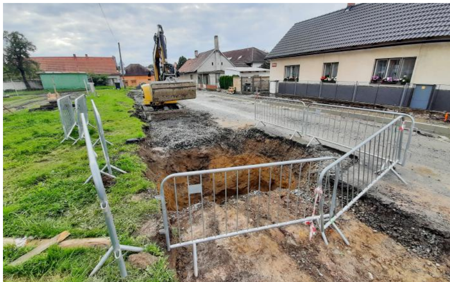
Žleby, ul. Za Šumavou - říjen 2021