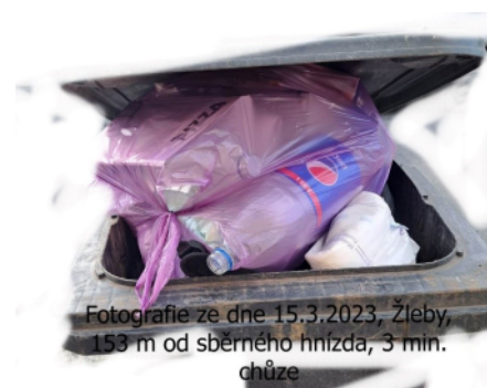
Fotografie ze dne 15. března 2023 Žleby, 153 m od sběrného hnízda (3 min. chůze).

za popelnice nastaven na výši 700 Kč za občana s trvalým pobytem (vyjma dětí do 7 let) a nemovitost určenou k rekreaci. Pokud bychom však chtěli s odpadovým hospodářstvím skončit takzvaně na nule, pak by každý z 1361 občanů naší obce musel již v roce 2022 zaplatit částku přibližně 1900 Kč. Co tím chceme říct? Nehodláme poplatky za popelnice hnát do závratných výšin, ačkoliv jejich zvyšování se jistě nevyhneme, ale chceme apelovat na obyvatele obce, aby se zamýšleli nad odpady odcházejícími z jejich domácností, nad tím, kolik odpadů vyprodukují a jak s nimi nakládají. Aby tím, že se jim nechce třídít odpad a nosit jej na sběrná místa, nezatěžovali obecní rozpočet zbytečnými náklady na dodatečné vytrídění odpadů.