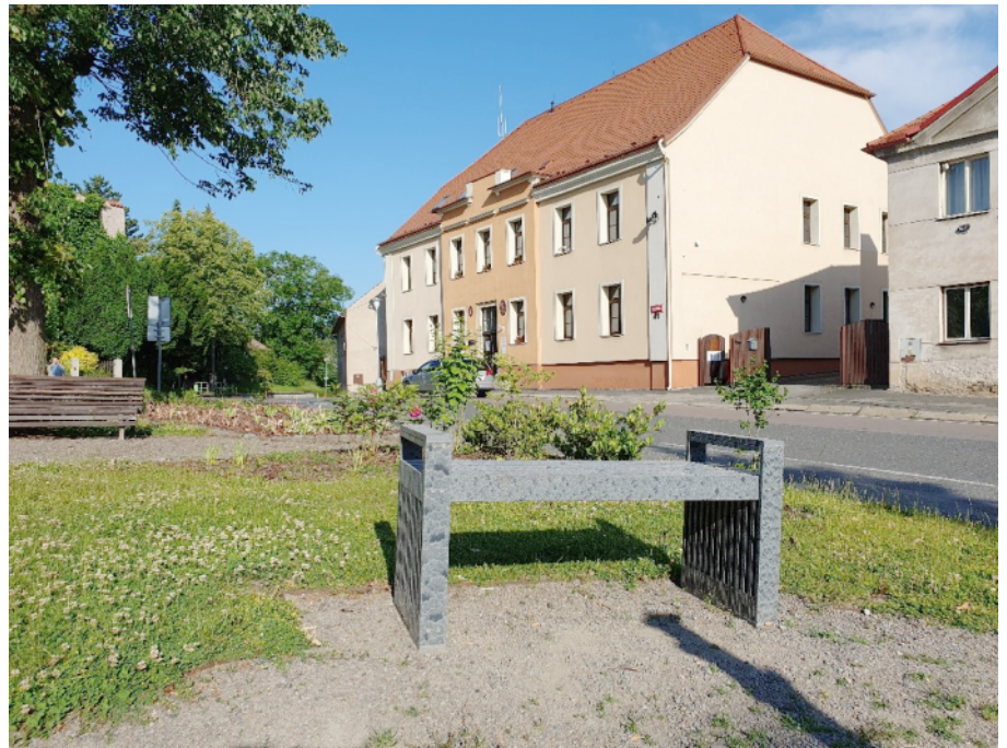
Lavička vyrobená z recyklovaného materiálu – textilu, životnost je odhadována na 20 let.

Květnové zasedání zastupitelstva se již tradičně konalo v hasičárně v Zehubech. Zastupitelům byly mj. předloženy cenové nabídky na výrobu nového nábytku do knihovny ve Žlebech. Již před několika lety vypracovala firma RespectRoom z Kutné Hory návrh interiéru knihovny a nyní dojde k jeho realizaci. Na obnovu vybavení knihovny byla získána dotace od Středočeského kraje ve výši 70 tisíc korun. Dotace ve výši 220 tisíc korun byla získána i na